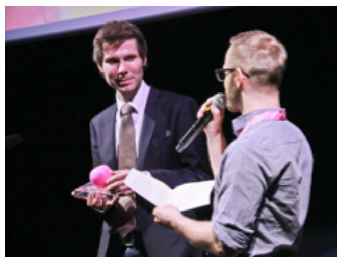
Impressionen 18. Pink Apple 2015: Eröffnung und Verleihung des Pink Apple-Awards an Lionel Baier