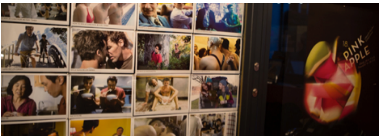
Impressionen 18. Pink Apple 2015: Produktplatzierungen, Filmbewertungskarte, Plakate